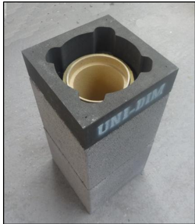
-Thermoelement aufsetzen und vorsichtig andrücken