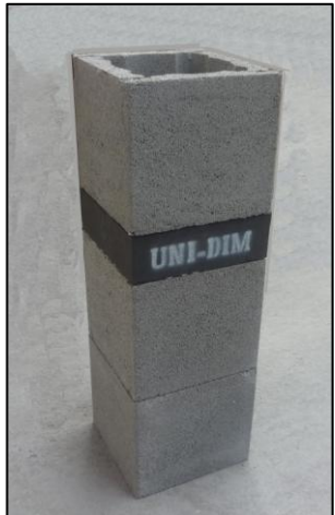
-Mantelstein aufsetzen -Danach das Kaminsystem lt. Versetzanleitung weiter versetzen

Hinweis: Um Folgeschäden zu vermeiden, ist den Anweisungen in dieser Versetzanleitung Folge zu leisten!