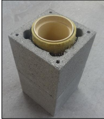
-UNI-DIM Kaminsystem bis zur gewünschten Höhe versetzen